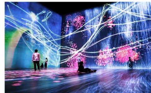
Tokyo teamLab Planets