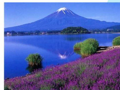
大石公園・富士山