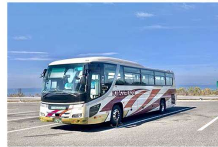
Shuttle Bus→Universal Studio