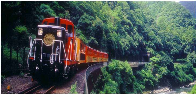
嵯峨野浪漫小火車