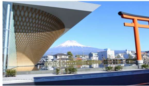
静岡富士山世界遺産center