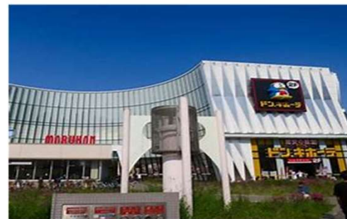
飯店附近-MEGA Don Quijote(Discount Shop)